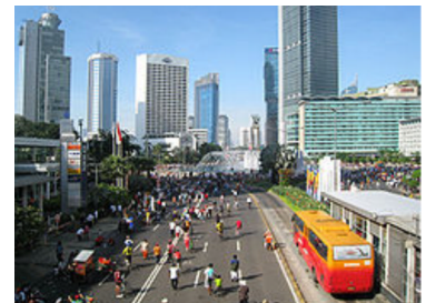
A picture of Jakarta

The capital of Indonesia is Jakarta in Java. Look. This is a picture of Jakarta. It is a very big city. It looks as big as Tokyo. There're about 238 million people and 3,000 races in my country. It is called "Multi Ethnic", because many races live together. People in my country are very friendly. I think we are trying to live in harmony.