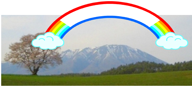
The rainbow over Mt.Iwate